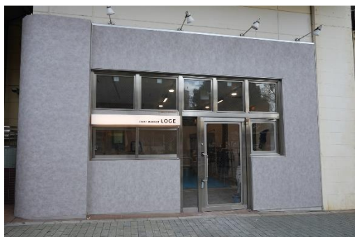
<「FORT MARKET LOGE」外観>