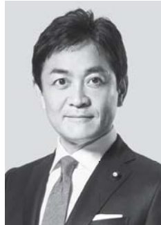
国民民主党 代表 玉木雄一郎