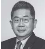
党書記局長 小池 晃 現 59歳。参院議員3期。全国革新懇代表世話人。医師。 活動地域 東京