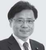
党参院幹事長・国対委員長 井上 さとし 現 61歳。参院議員3期。 活動地域 東海、北陸信越、京都