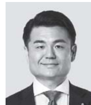
かわの 義博 現 役職:党食品ロス削減推進 プロジェクトチーム事務局長、 参院議員1期。 経歴:慶應義塾大学経済学部卒。 年齢:41歳 近い。速い。温かい。

公明党は、参院選比例区に上記の6人をはじめ17人を公認しています。(順不同) ※年齢は公示日現在