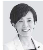
山本 かなえ 現 役職:元厚生労働副大臣、 参院議員3期。 経歴:京都大学文学部卒。 年齢:48歳 「あなたの声を、かなえるチカラ。」