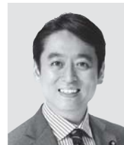
平木 だいさく 現 役職:元経済産業大臣政務官、 参院議員1期。 経歴:東京大学法学部卒。 年齢:44歳 未来をひらく 確かな実力!