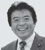
弁護士 仁比 そうへい 現 55歳。参院議員2期。党参院国対副委員長。 活動地域 中国、四国、九州・沖縄