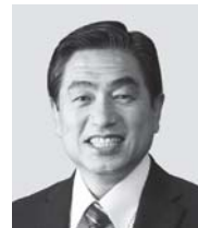
若松 かねしげ 現 役職:元復興副大臣、参院議員1期。 経歴:中央大学一部卒、公認会計士、 税理士、行政書士。 年齢:63歳 「現場第一」で復興・防災に全力