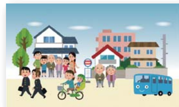
交通の利便性が高い住環境