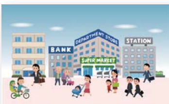
にぎわいのあるまちづくり