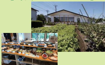
隣接する生産緑地の所有者が経営するレストラン