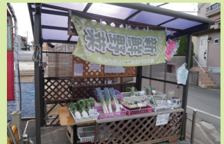
市内の直売所 (中和泉四丁目)