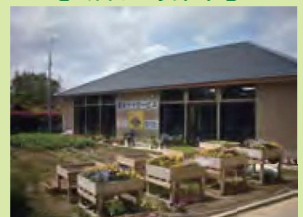
デイサービス利用者が施設に隣接した農地で農作業を実施