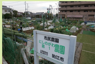
市内の市民農園 (西野川一丁目)