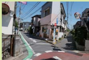
市内の狭い道路 (東和泉二丁目)