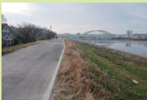
現在の多摩川の堤防 (元和泉三丁目)