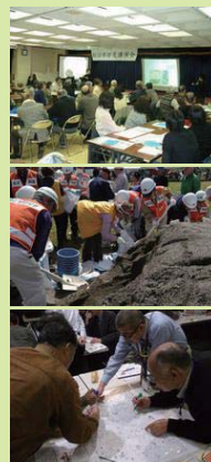
狛江市防災会の支部の区分

市内には、共助を行う自主防災組織として、「狛江市防災会」と「狛江市避難所運営協議会」があり、地域住民の皆さまが主体となり、訓練等を通じて防災意識を高めています。