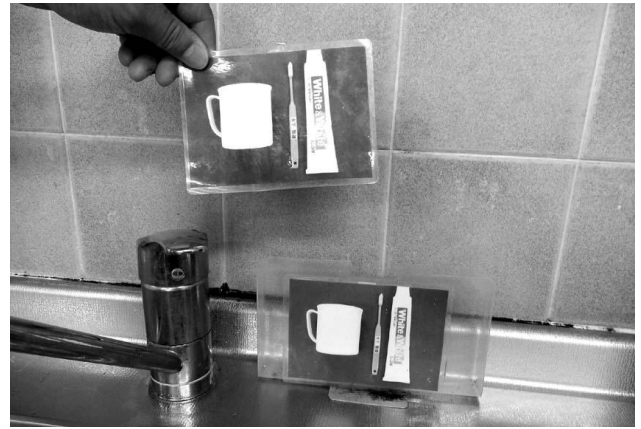
写真カードを使った手順と場所のマッチングの例