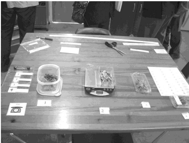
ハーブを計量機で計ってパッキングする作業の手順の提示