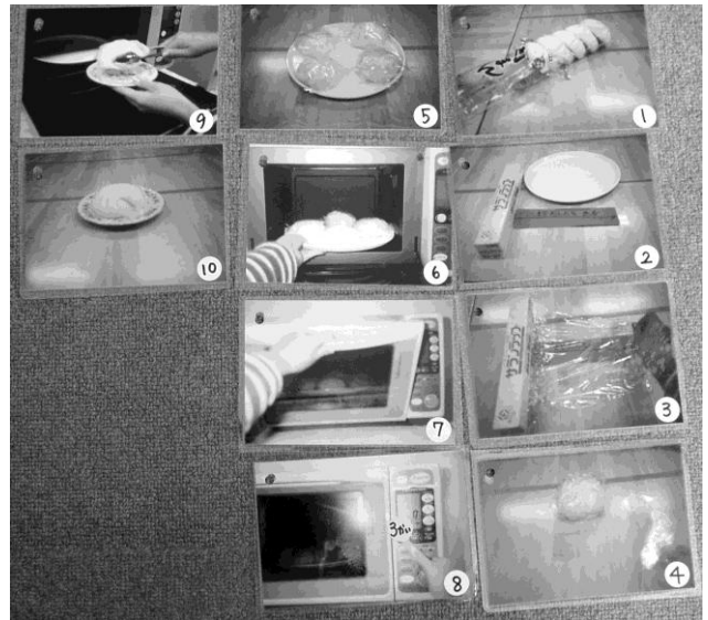
写真を手掛かりにした肉まんを電子レンジで調理する手順書

課題で扱う材料の組み立て方等について、手順書、指示書によって「どのように」をわかりやすく、視覚的に伝えます。プラモデルの設計図に当たるようなものです。また、サボタージュ場面（例えば、あえて材料の一部を抜いておくこと）により、適切な要求の方法を支援することもできます。