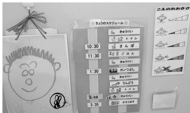
文字と絵によるスケジュール提示 声の大きさも視覚化

「いつ」「どこで」「なにを」という情報を、文字や絵、写真など、または実物等、一人ひとりの理解レベルに応じてスケジュールを提示します、また、提示の範囲も、1日単位から半日単位、次の予定のみ等、利用者の理解度によって提示します。スケジュールの意味理解ができてくると、変化が苦手な人でも、予めスケジュールカードを差し替えることで混乱なく受け入れることができるようになります。このように本人が理解できるスケジュールを提示することで「見通し」を持ってもらうことができます。