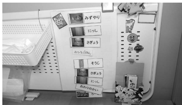
文字と写真によるスケジュール提示の例