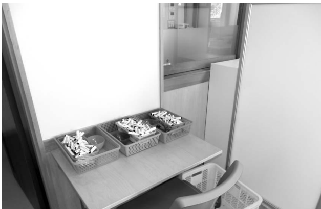
パーテーションを使った境界線の例

また、一つの場所を多目的に使用すると混乱しますので、例えば、作業をするところはワークエリア、おやつはフードエリア、遊びはプレイエリアというように場所と活動を一致させると利用者にとってわかりやすくなります。