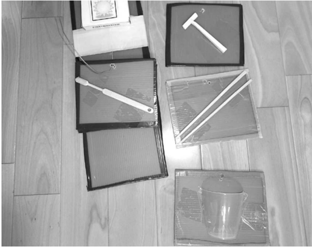
実物を使ったスケジュールの例