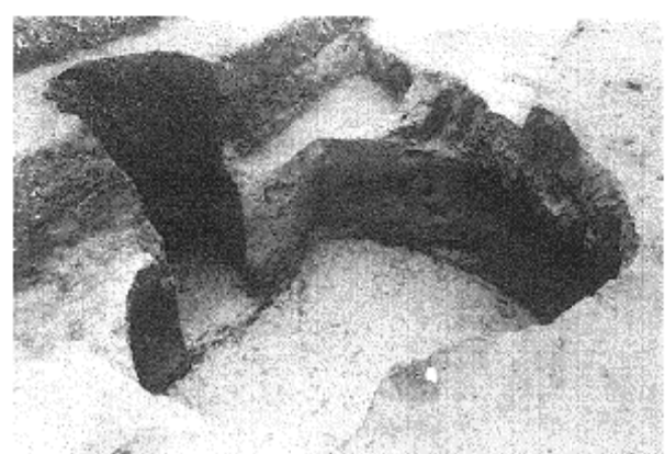
地下式坑（塚上遺跡）