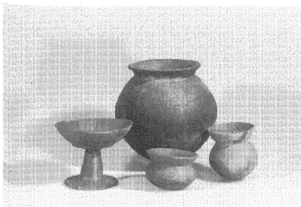
和泉式土器（和泉遺跡出土）

このような調査成果から、これらの遺跡は、和泉遺跡と同時期の集落遺跡であったことが考えられますが、このほかにも同様の遺跡が市内にはまだ存在することも予想され、今後の調査にも期待がもたれます。また、亀塚古墳とこれにより数軒の住居跡が削平された田中・寺前遺跡や、兜塚古墳とその造営を支えたと考えられる橋場遺跡、経塚古墳とその築造直後に相当する経塚遺跡といった、集落遺跡と狛江古墳群（5世紀前半から6世紀中頃まで市内一帯に造営されたと考えられる）との関係についての調査・研究の進展もぞまれます。