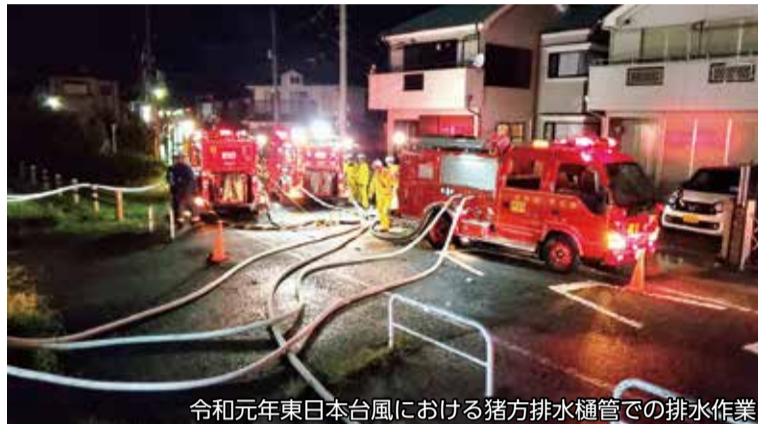
令和元年東日本台風における猪方排水樋管での排水作業