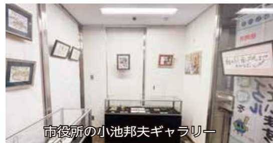
市役所の小池邦夫ギャラリー