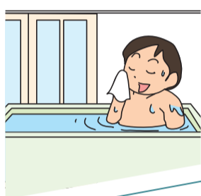
住人が在宅中、隙を見て侵入する