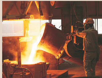
※写真:ひらけ!マンホールHPより引用