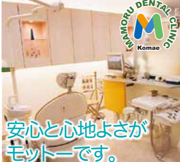
安心と心地よさがモットーです。

しっかり歯を磨いているのに……特に悪いところはないのに……日本人の30歳代の90%以上が歯周病にかかり、40~50歳で歯を失う原因の約50%が歯周病だと言われています。歯周病はなかなか自覚症状が現れないので、気付いたときには手遅れに……歯を支える歯槽骨が溶け、歯が抜け落ちてしまう怖い病気です。歯周病は、細菌による感染症です。細菌は粘着性の強いプラーク(歯垢)を格好のすみかとし歯周病を引き起こします。このプラークは早めに取り除かないと歯の表面や歯周ポケット(歯と歯肉の間の溝)などに強固に付着し、自己流のブラッシングだけでは取り除けなくなってしまいます。そのため、歯科医院での定期検診が必要です。定期的にこのプラークを除去し、歯をクリーニングすることが大切です。歯を失わないために定期検診に行きましょう!