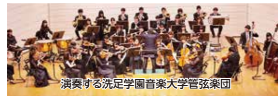
演奏する洗足学園音楽大学管弦楽団

フラワーアレンジメント 月1回(日) (6月は23日) 14:00~17:00岩戸地域センター。初心者可(花用またはキッチンバサミ)、持ち帰り用袋、ゴミ袋、新聞紙(小学生以上は同伴) 定先着10人 月1,500~2,000円(山本)