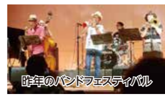
昨年のバンドフェスティバル