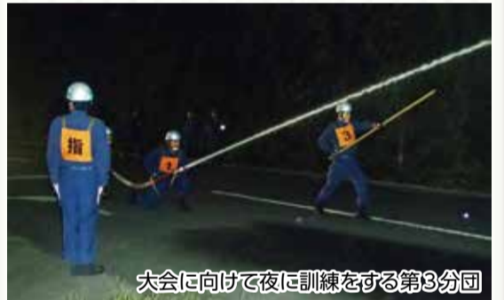
大会に向けて夜に訓練をする第3分団