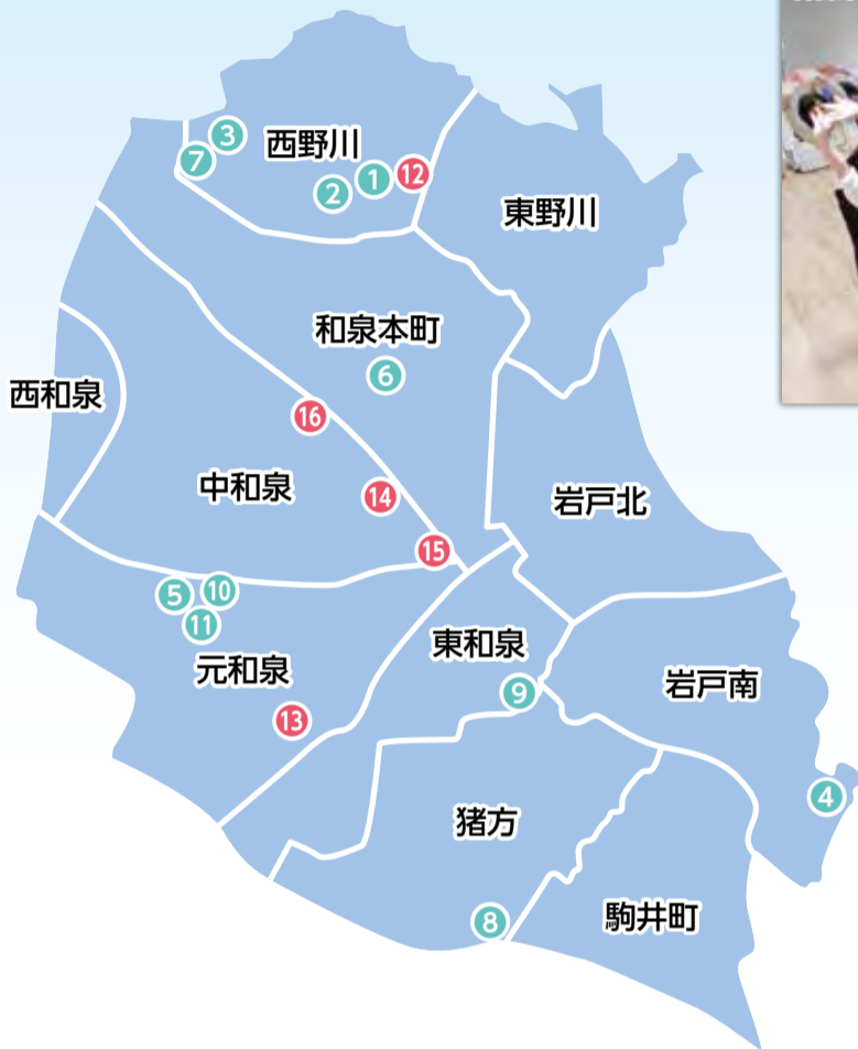
※地図中の番号は、下の表の番号を表しています。