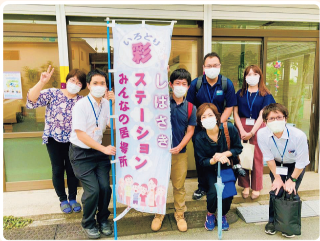
「多世代交流の小さな拠点（まちの縁側）の整備に向けたアクションリサーチ」現場見学会