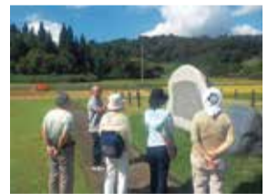
ぜひ第二のふるさとへ