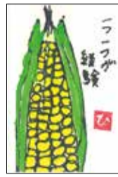
「絵手紙発祥の地—粕江」 公募展受賞作品