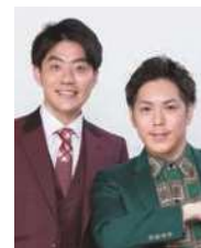
ネイチャーバーガー