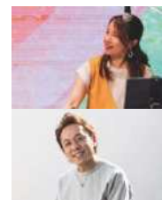
CAN PAN LIFE

2018年結成。ブラジルで多数の音楽活動に携わり、様々な経験から手に入れた友情、文化、質感、感覚とセンスを音楽に封じ込めている。