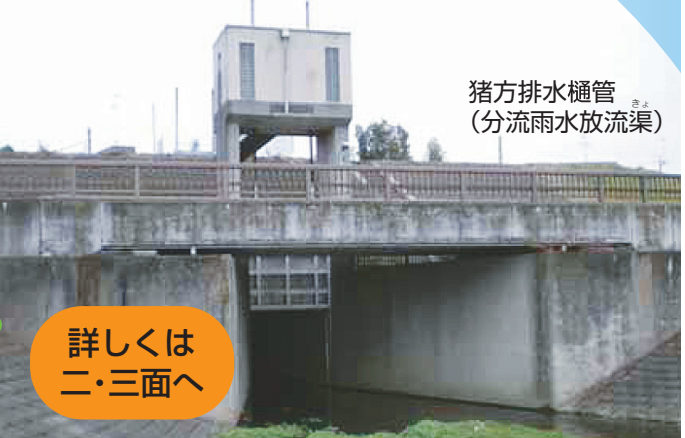
猪方排水樋管 (分流雨水放流渠)