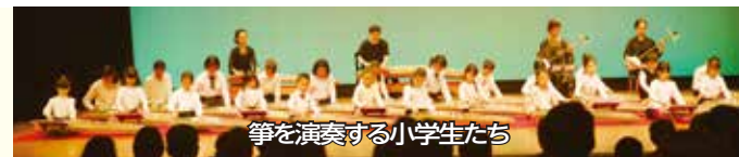
箏を演奏する小学生たち