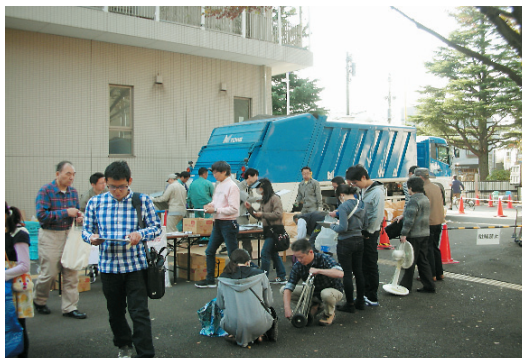
11月に実施されたイベントでの様子

※市庁舎駐車場は有料です。 (ただし、アンケート回答者は1時間無料) ( http://www.city.komae.tokyo.jp/ )