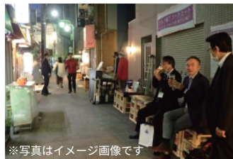
※写真はイメージ画像です