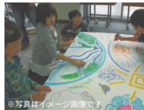
※写真はイメージ画像です