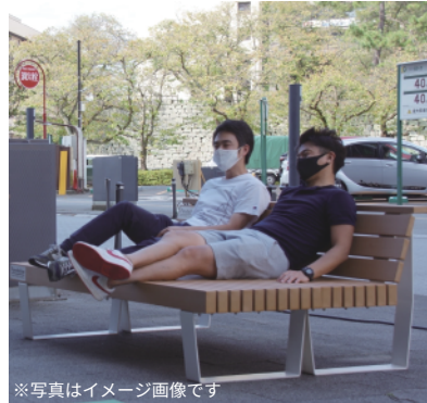
※写真はイメージ画像です