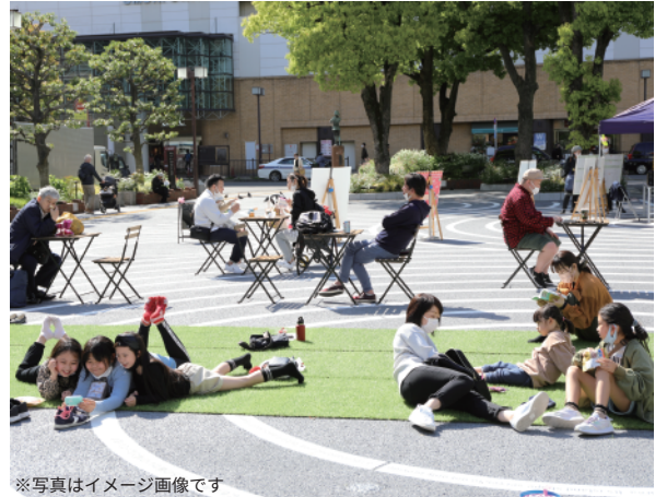
※写真はイメージ画像です