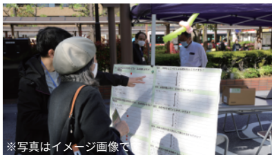
※写真はイメージ画像です