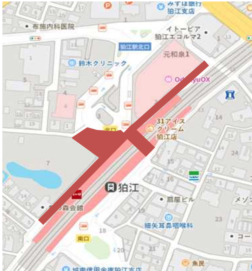
【狛江駅周辺の区域図】