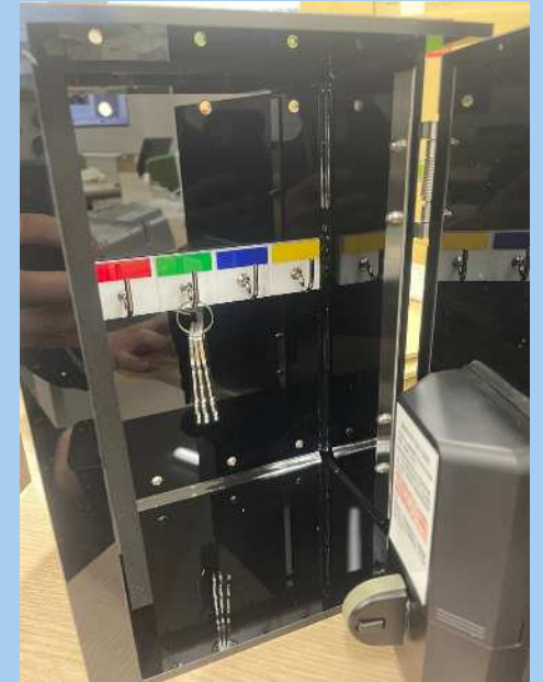
キーボックス内部 24