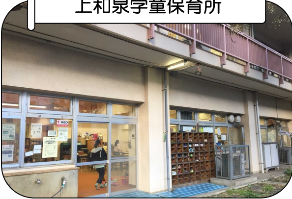
上和泉学童保育所