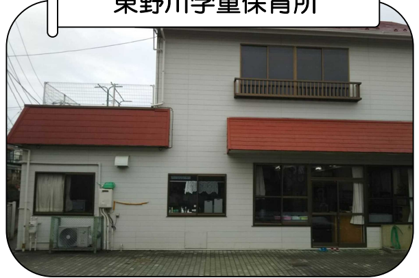
東野川学童保育所