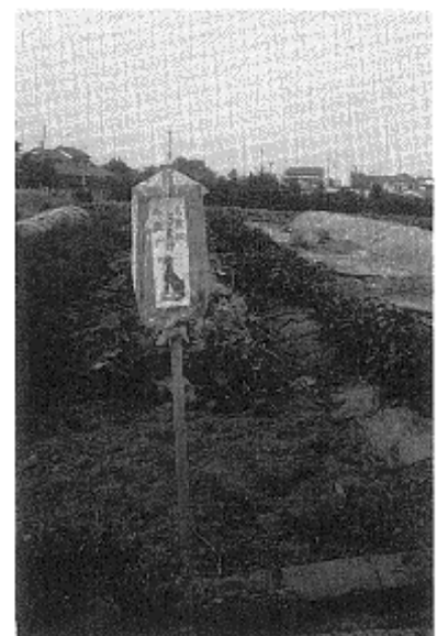
畑に立てられたお札(駒井)

覚東では、現在の講員数14戸。御嶽山にケーブルが開通する昭和26年以前は、御師の林家に一泊していました。代参から帰ると、代参者の