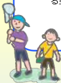
「狛江市小学生環境サミット」 平成 30(2018)年度