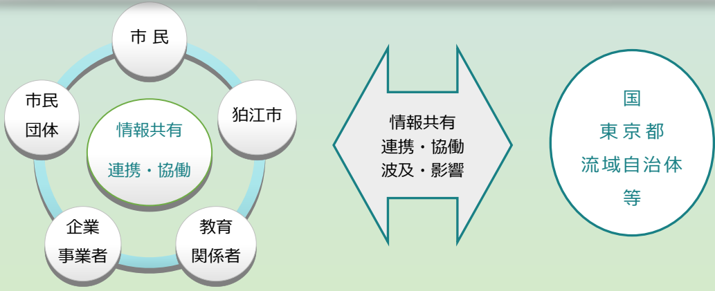
《主体間の連携・協働のイメージ》

生物多様性に係る狛江市内の多様な主体が、それぞれの役割を担うとともに、相互に連携・協働することによって、効果的・効率的・継続的な取組を推進します。