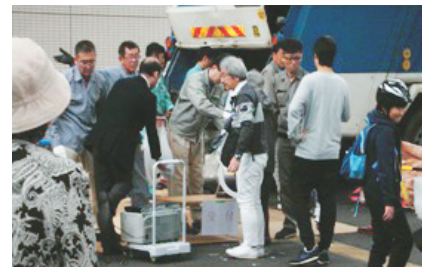
▲10月に実施されたイベントの様子

※市庁舎駐車場は有料です。 (ただし、アンケート回答者は1時間無料) ( http://www.city.komae.tokyo.jp/ )