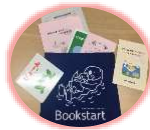
ブックスタートパック