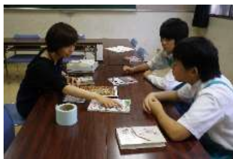
【中学生の職場体験】