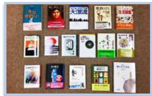
サードブック対象本