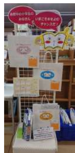
休校中の小学生に向けたお楽しみ袋の貸出。