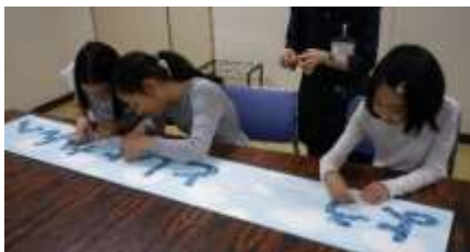
図書貸出室の入り口にある看板を装飾

【全 12 回（日曜日 10 時 30 分～正午 ※10 月 20 日のみ午後 1 時 30 分～4 時 30 分）】