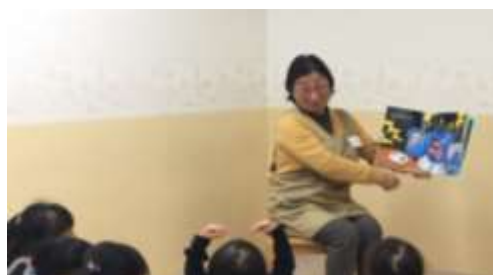
おはなし会ボランティアの様子

新型コロナウイルス感染症予防対策のため、2月 26 日からボランティア活動を休止としました。