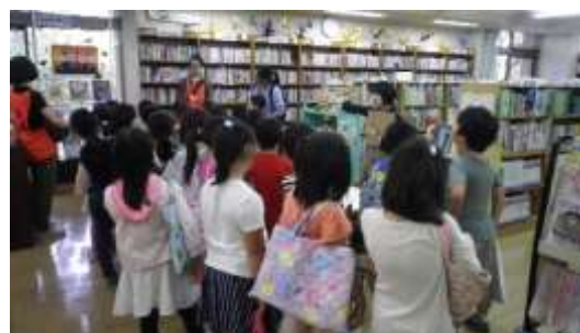
【小学生の施設見学】