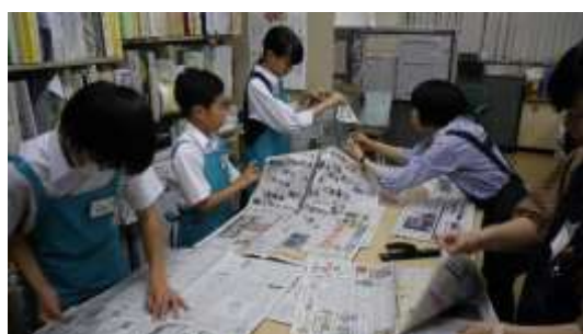
【中学生の職場体験】