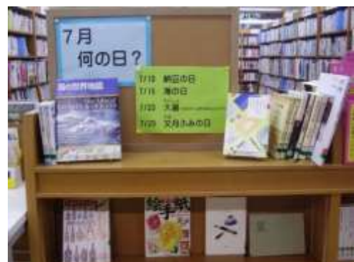
7/3～7/31 「7 月何の日?」