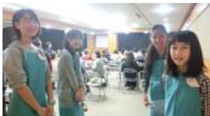
イベントの会場スタッフとして活躍

本や図書館に興味のある子どもが集まって、日曜日の午前中に、さまざまな活動を行うクラブです。小学校高学年以上の利用率の下がる年齢層を主な対象とし、日曜日に企画することで、平日に図書館を利用する機会の限られる子どもの利用促進を図ります。また、固定の参加者を募り、単発のイベントで終わらせずに、継続してつながりのある内容に取り組むことで、同年代の参加者同士の交流と、図書館員と参加者の親交の機会を作ることを目的とします。