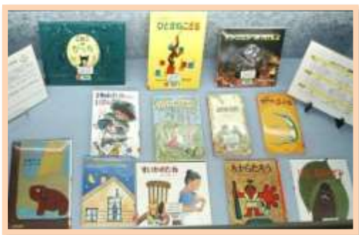
セカンドブック対象本