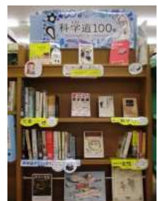
2/5～2/28 「科学道 100 冊 2019」