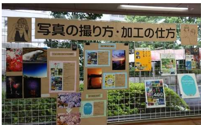
8/14～8/26 「写真の撮り方・加工の仕方」