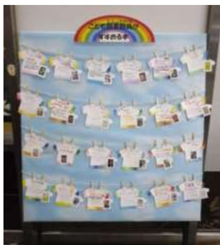
子ども図書館員が描いたTシャツ型のPOPカードを吊るして掲示。