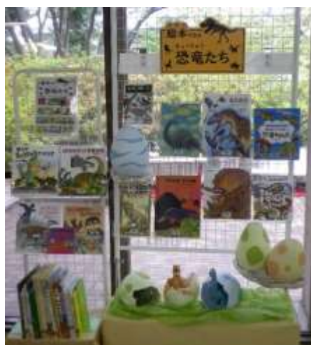
風船と和紙を材料にした恐竜の卵は、図書館員の手作り。