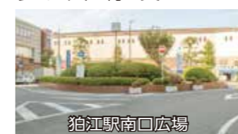
⑤ 揚辻稲荷神社 東和泉1-26

などの看板が立つ。完成当時は周辺に大きな建物がなかったが、現在では銀行や飲食店などのビルが建ち、多くの人が行き交う。