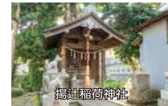
⑥ 清水川公園 東和泉2-9

住宅街の一面にあり、「谷田部稲荷」とも呼ばれ、赤い鳥居と社殿がある。社殿裏に小さな池があり、約60年前まで水が豊富にわき、池から岩戸方面へ農業用水が流れていた。