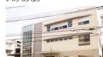
⑧ 石橋供養塔 岩戸南1-4

交流の拠点として昭和53年に開館。施設の老朽化に伴って建て替えられ平成27年にリニューアルオープンした。鉄筋コンクリート造り地上3階地下1階建てで、会議室や音楽室、創作室、料理実習室、図書室などのほか、岩戸町会専用のスペースがある。