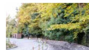
⑦ 岩戸地域センター 岩戸南2-2-5

弁財天池が水源の用水だった清水川の跡地に平成25年に防災機能を有する公園として整備された。広場にベンチや東屋などがあり、憩いの場になっている。防災倉庫をはじめ防災用井戸、災害対策用トイレ、かまどスツールなどを備えている。