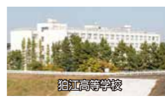
② 狛江高等学校 元和泉3-9-1

発行 ● 狛江市政策室 〒201-8585 狛江市和泉本町1-1-5 ☎ 3430-1111 FAX3430-6870 Email=wacco@city.komae.lg.jp 編集・制作 ● 特定非営利活動法人 k-press 〒201-0003 狛江市和泉本町1-35-3 ル・ミリオン・イダ3階A号 ☎ 3430-6617 FAX3430-6743