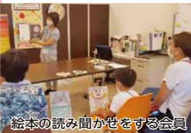
絵本の読み聞かせをする会員

同会は、狛江市と東京都健康長寿医療センター研究所が主催した絵本読み聞かせ講座を修了した11人が、講座で学んだことを認知症予防と地域貢献のために生かそうと昨年1月に発足した。会員は66歳以上の市内在住の女性が、月1回の定例会では読み聞かせに行く人や読む本を選ぶほか、滑舌体操や発声練習などを行って技術を磨いている。昨年は新型コロナウイルス感染症の影響で3月から6月は活動を自粛したが、7月から感染予防対策をして再開した。