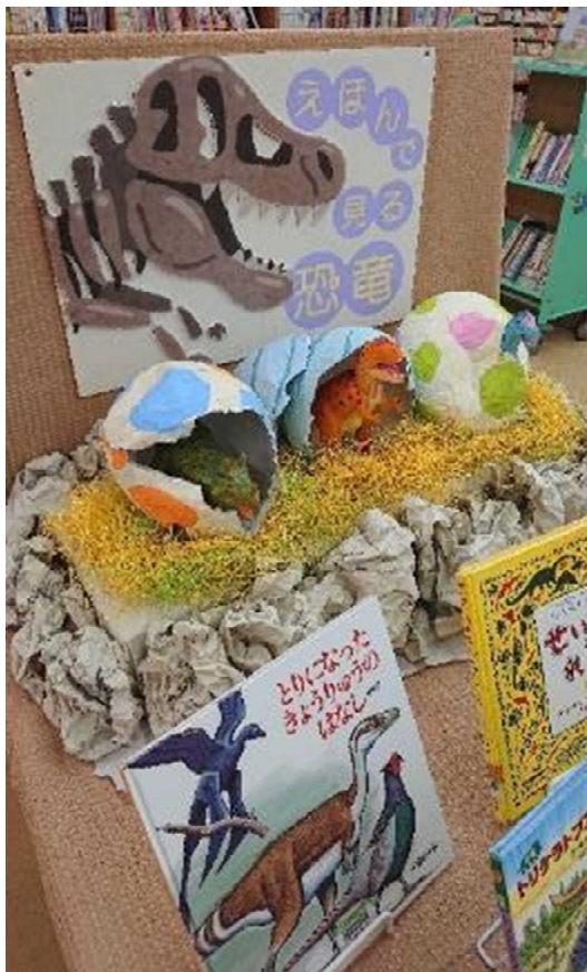
8月)恐竜の絵本、大集合!