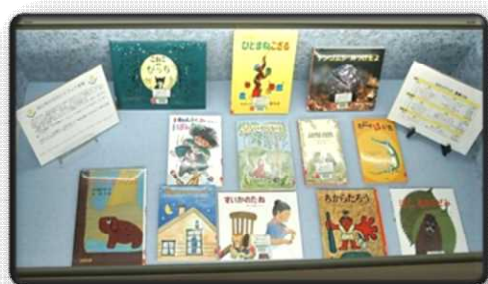
【セカンドブック対象本】