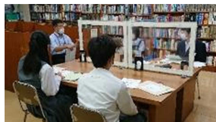
【中学生の職場訪問】

2年度は、新型コロナウイルス感染症予防対策を施した内容を担当教員と相談し、日程を縮小するなどの調整をしたものの、残念ながらそのほとんどについて実施を見合わせる結果となりました。