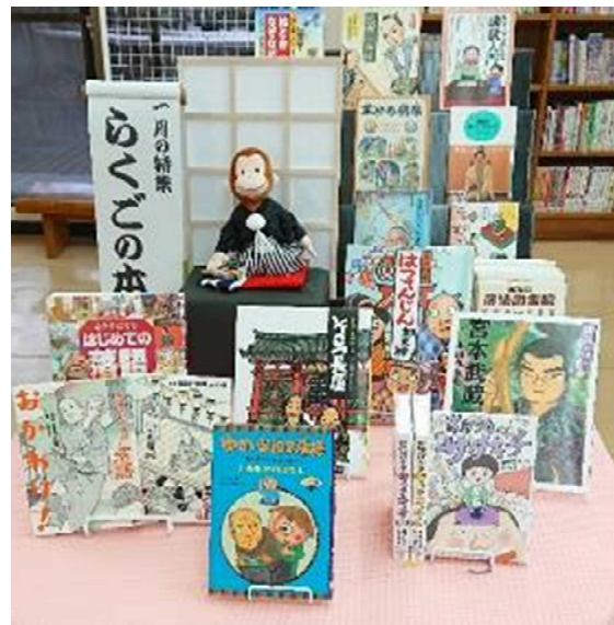
1月)日本の話芸が題材の本