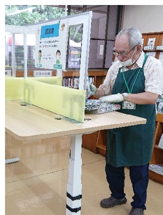
【予防対策をして作業する様子】

2年度は、新型コロナウイルス感染症予防対策のため、休館中の活動を中止し、再開後も様々な制限や条件の中での取り組みとなりました。やむを得ず活動を自粛される方もいらっしゃいましたが、「図書館に通うことが日常生活において習慣となっていることを改めて認識した」「無理のない範囲でボランティアを継続していきたい」という感想が寄せられています。