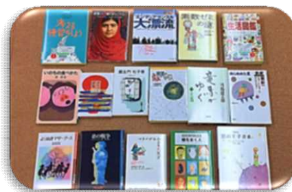
【サードブック対象本】