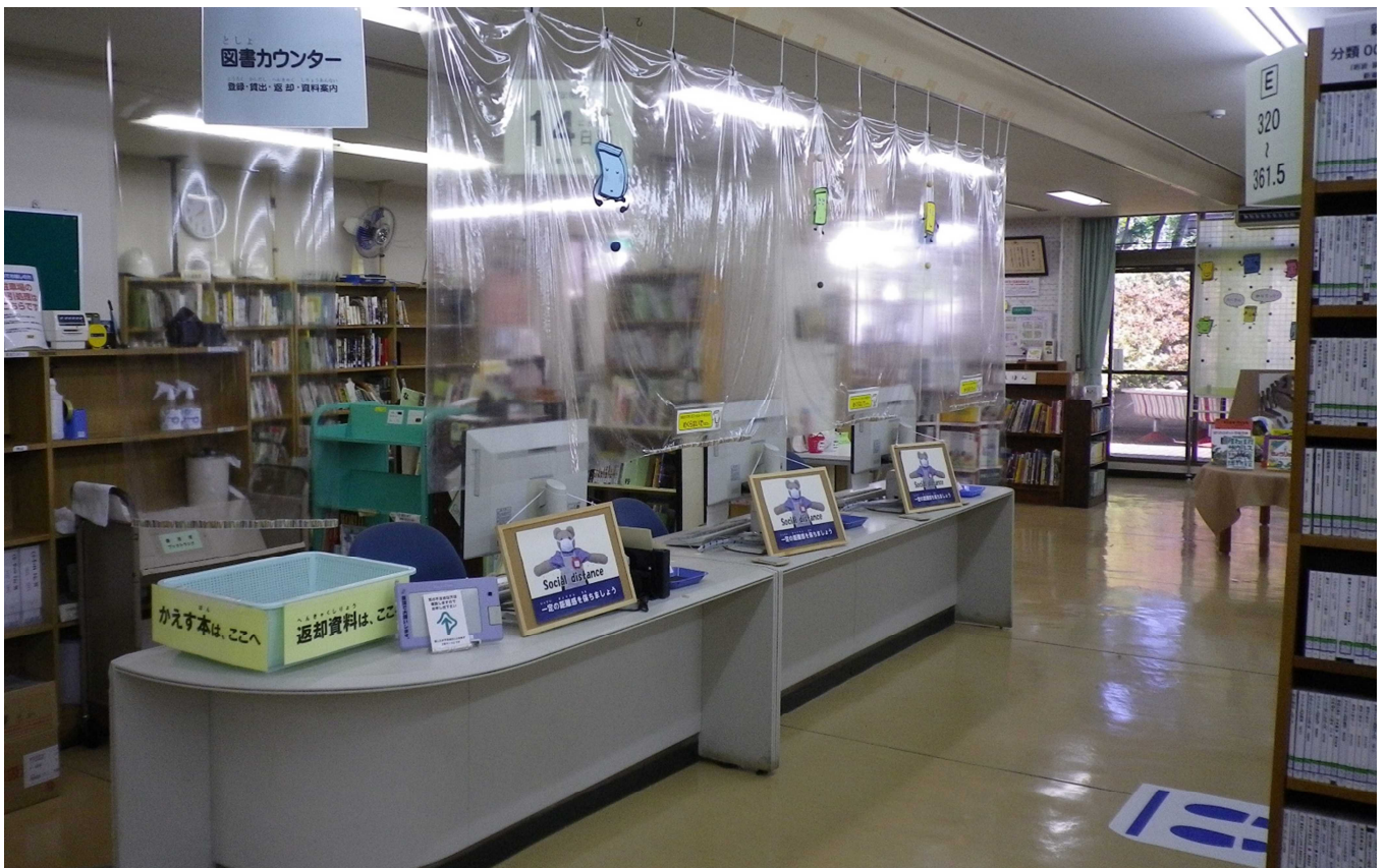
【各図書館・図書室では、新型コロナウイルス感染症予防対策の徹底に努めています】