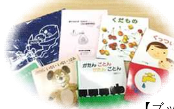
【ブックスタートパック】