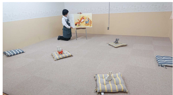
【イメージ写真】平時のおはなし会とは違い、離れて置いた座布団に座ってもらい、大型絵本を使用するなどしました。