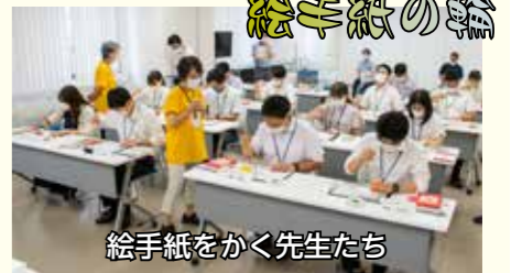
絵手紙をかく先生たち

市内8校から14人の先生が参加、「絵手紙発祥の地-狛江」実行委員会の委員から絵手紙の基本的な知識や筆の持ち方、彩色の仕方など基礎について説明を受けた後、パブリカやナス、レモンを画材に真剣な表情で絵手紙をかいた。参加した先生たちは「実際にかいてみると難しい。でも、すごく楽しかった」「いつもは教える側なので、新鮮でした」「今度は子どもたちと一緒にかいてみたい」などと話していた。