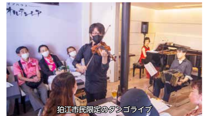
狛江市民限定のタンゴライブ

☎070-6463-0527、東和泉3-7-4、営業時間=原則午前10時～午後8時30分。不定休