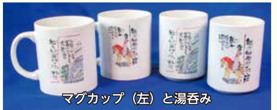
マグカップ(左)と湯呑み

狛江駅北口ロータリーの排気塔にかかれた巨大絵手紙をモチーフにしたマグカップ、湯呑み、トートバッグを(一財)狛江市文化振興事業団が発売している。