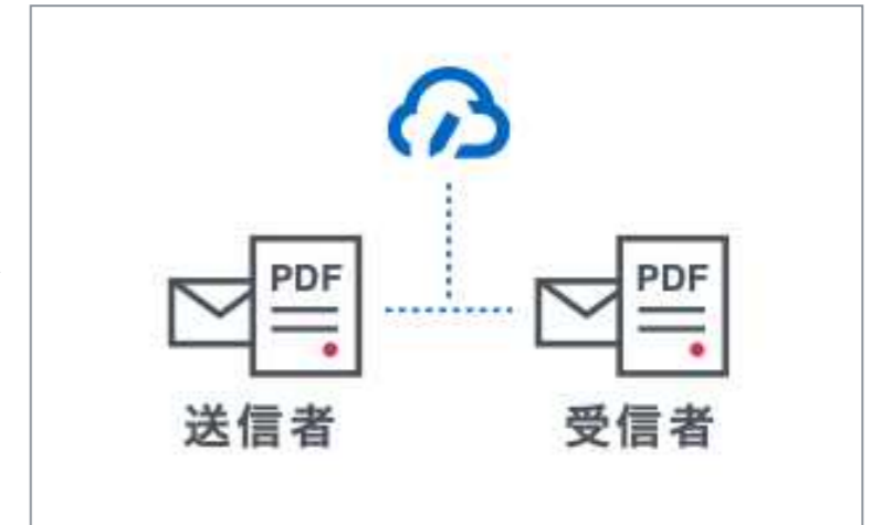
締結後書類を印刷・PDFで保管