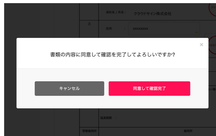
契約書確認・合意