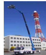
照明車展示・操作体験