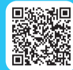
「熱中症予防スポット」市ホームページ