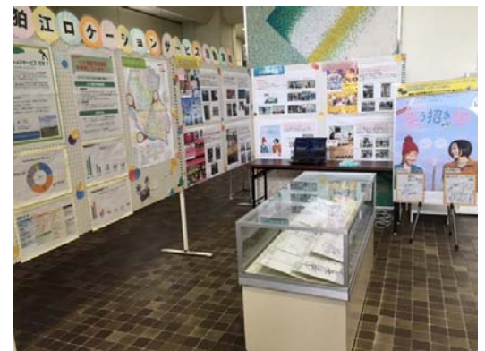
昨年度の展示の様子

撮影支援を行う会社(デイ・ナイト株式会社)と契約を結び事業を行っており、ロケ物件の紹介・誘致から撮影場所の申請手続きの支援、夜間や休日の対応可能な施設を含め、全てのロケへの立会いによる円滑な撮影の支援、撮影された番組や場所のPR等を行っている。