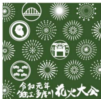
ミニタオル（イメージ）

花火大会をさらに盛り上げる企画として、当日ゆかたを来て来場された方、先着 300名にミニタオルのプレゼントを予定しています。