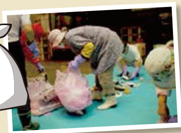
▲組成分析の作業の様子