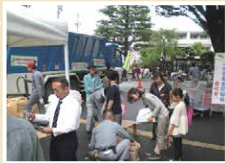
▲6月に実施されたこまエコまつりでの様子