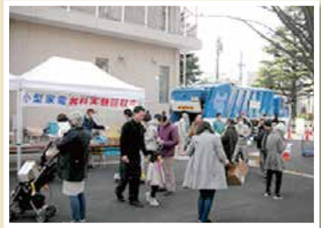
▲3月に実施されたイベントでの様子