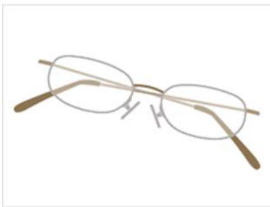
ろうがんきょう 老眼鏡