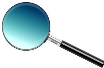
かくだいきょう 拡大鏡