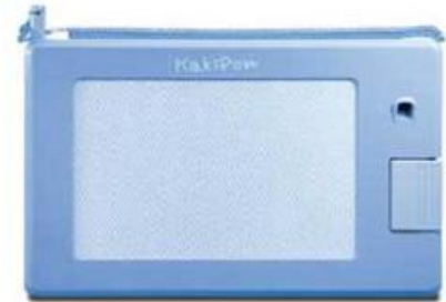
ひつだんぼーど 筆談ボード