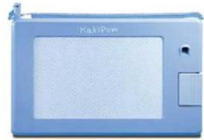
ひつだんぼーど 筆談ボード