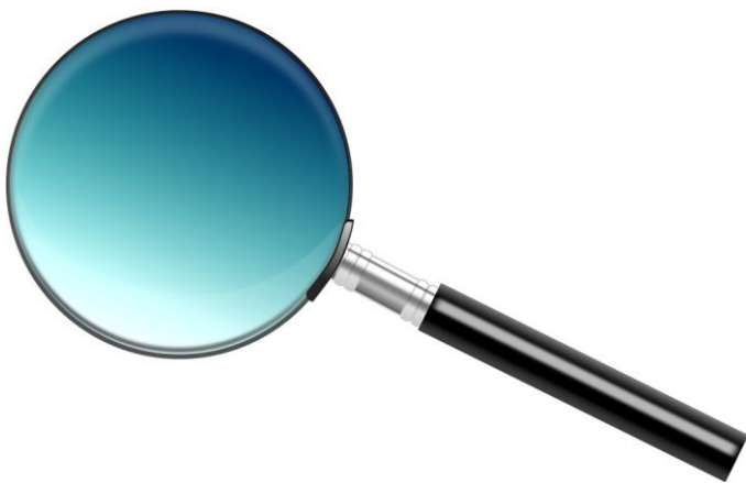
かくだいきょう 拡大鏡