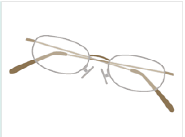
ろうがんきょう 老眼鏡