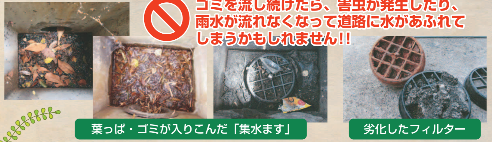
葉っぱ・ゴミが入りこんだ「集水ます」

A.4 「集水ます」は、雨水を流すためのものなので、生活排水やゴミを流してはいけません。また、余ったコンクリートなどを流すのは絶対にやめてください。雨水は、下水道管の中を流れ、川へ放流されます。ゴミやタバコの吸殻、ペンキなどを流すと川を汚すことになってしまいます。