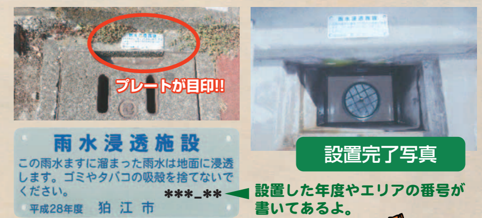
雨水浸透施設 この雨水ますに溜まった雨水は地面に浸透します。ゴミやタバコの吸殻を捨てないでください。 ***_** 平成28年度 狛江市

A.3 浸透機能つき「集水ます」は、ますの底に穴をあけて、雨水がしみ込みやすいように、穴のあいたパイプに砂利をつめたものを設置した構造になっています。現代のアスファルト舗装では、雨が地面にしみこみにくい構造ですが、浸透機能つき「集水ます」を使うことによって、降った雨が地面にしみこむため自然に近い状態を保ち、地盤沈下を防ぎ、湧き水や井戸が枯れないようにしています。また、ゲリラ豪雨による浸水被害の防止にも役立っています。