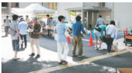
▲ 5月に実施されたイベントでの様子