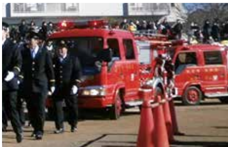
ポンプ車のパレードも実施いたします

で可搬ポンプを運び、消火活動を行います。 また、大阪府北部地震でブロック塀が倒壊したことを受けて、全分団にコンクリート等破壊器具が配備されました。器具自体の重さを利用し、コンクリート瓦礫等を破壊し、下敷きになった人を救出します。