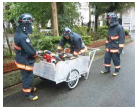
可搬ポンプとリアカー