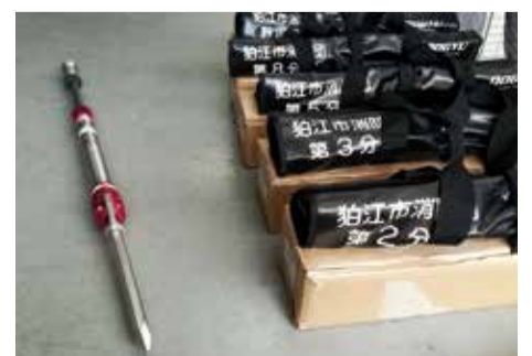
コンクリート等破壊器具

で可搬ポンプを運び、消火活動を行います。 また、大阪府北部地震でブロック塀が倒壊したことを受けて、全分団にコンクリート等破壊器具が配備されました。器具自体の重さを利用し、コンクリート瓦礫等を破壊し、下敷きになった人を救出します。