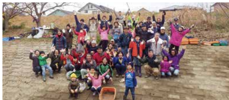
みんなの力できれいにしよう!