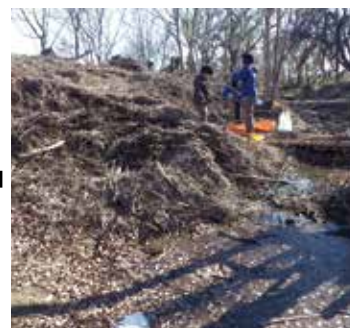
湧き水周辺にも大量のごみが堆積しました