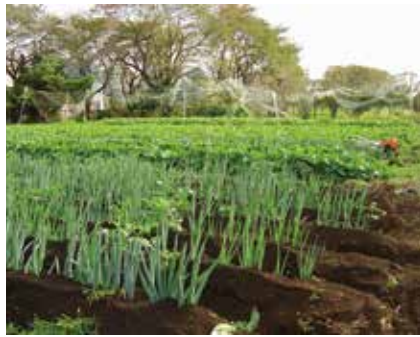
おいしい狛江産野菜と一緒に育てませんか

援農ボランティア制度とは、農業者の方の労働力不足を補うために、自然に触れ合いながら農業のサポートを行いたい市民等がボランティアとして農作業のお手伝いを行う制度です。