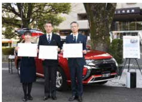
協定締結式の様子

締結先 東日本三菱自動車販売株式会社、三菱自動車工業株式会社 協定内容 災害が発生した際に、電動車両等の貸与等を行う。 ☎安心安全課