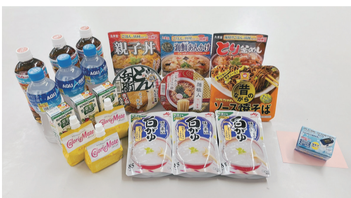
(左から)食料セット、血中酸素飽和度測定器(イメージ)

申 電話・ファクスまたは市ホームページの専用フォームから、健康推進課(あいとびあセンター) ☎(3488)1181、☎(3488)9100へ。