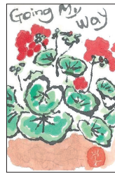
「絵手紙発祥の地—粕江」 公募展受賞作品