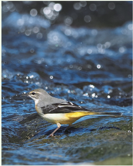
宿河原堰下の中洲に飛来したキセキレイ