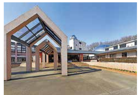
さしま少年自然の家

■ 申請 7月24日(日)までに、電子申請(兄弟姉妹は2人まで同時に申し込み可)で子ども政策課企画支援係へ。