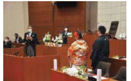
お二人の門出を祝福します