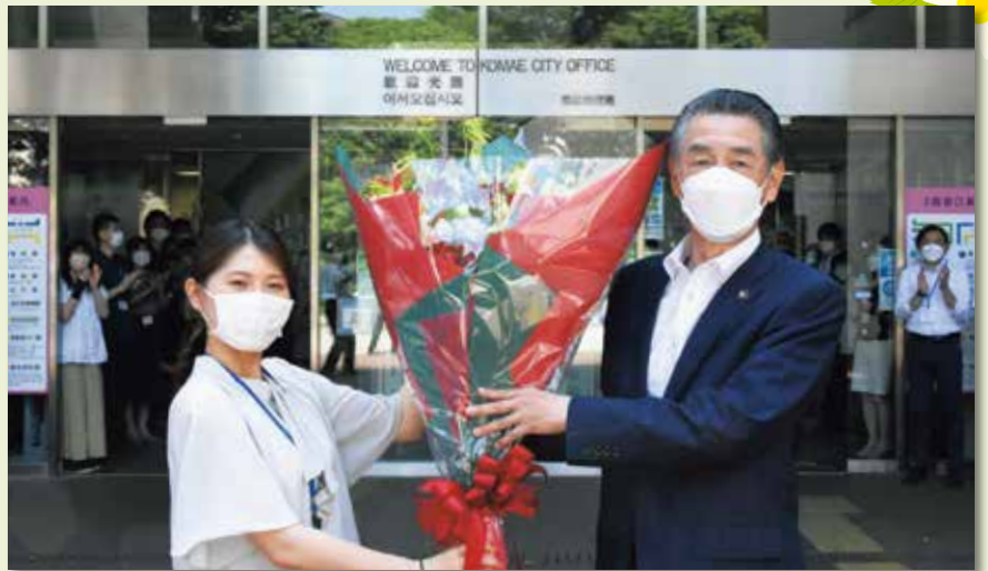
市民や職員に迎えられた松原市長（右）

6月28日(火)午前9時、市民の皆さんや職員が見守る中、松原俊雄市長は選挙後初登庁しました。