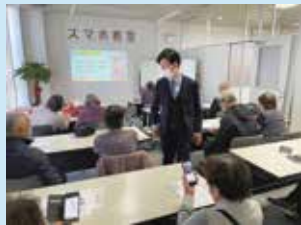
できることから災害に備えましょう

8月2日以降の毎週火曜日(終了時期未定) ※各回同一の内容のため、ご都合に合う日程に参加ください。 午後2時~4時 auショップ狛江2階会議室(元和泉1-2-1エコルマ1ビル1階) 各回先着14人 災害対策アプリや緊急速報メール、災害用伝言板等の使用方法に関する紹介を行います。 ※auのスマートフォンをお持ちの方に限らず、どなたでも参加できます。 申問 auショップ狛江 ☎(5497) 7018、☎0800(700)9382へ。