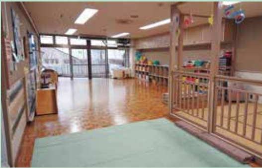
保育相談もできます。ママもパパも大歓迎です。