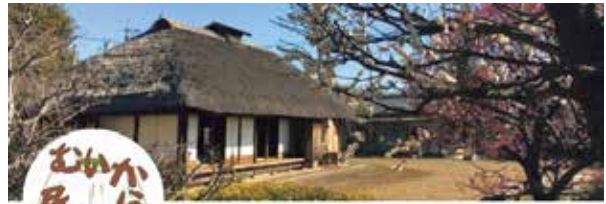
プロフィールを掲載