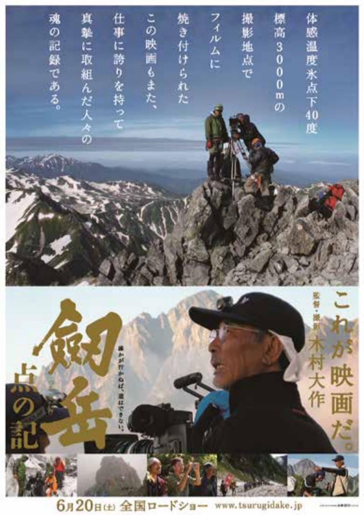
映画公開当時のポスター